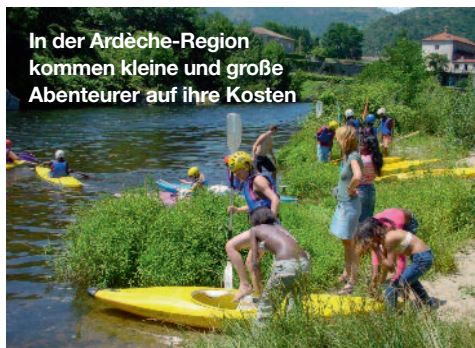
In der Ardèche-Region kommen kleine und große Abenteurer auf ihre Kosten