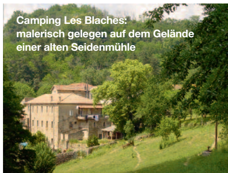
Camping Les Blaches: malerisch gelegen auf dem Gelände einer alten Seidenmühle