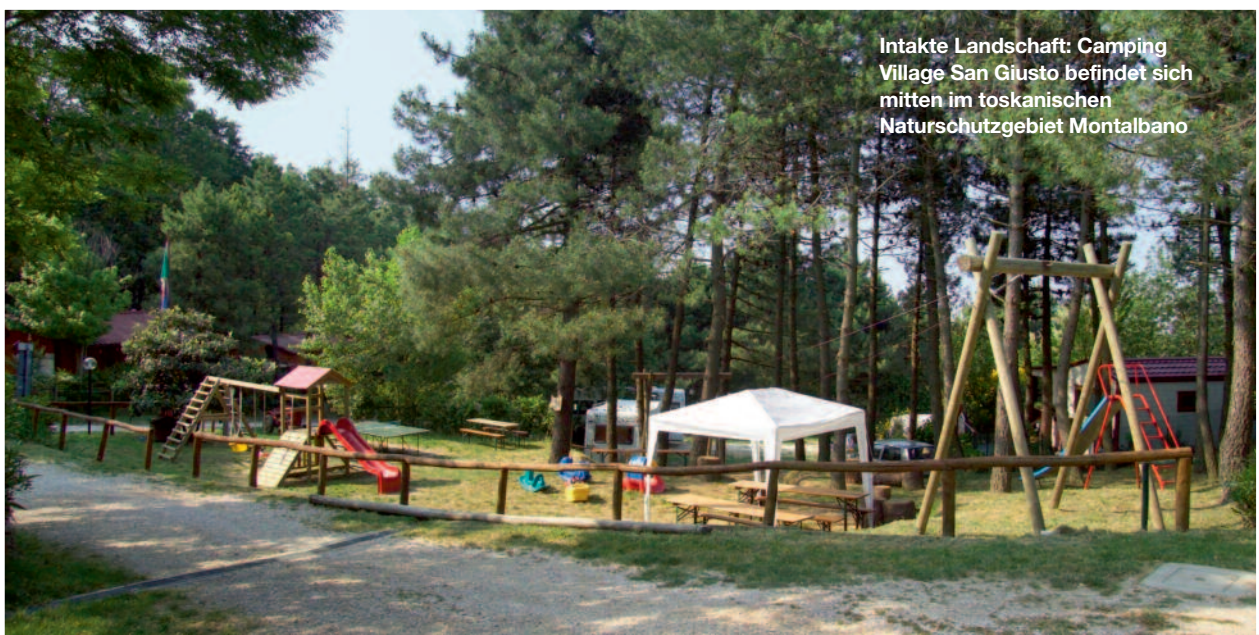
Intakte Landschaft: Camping Village San Giusto befindet sich mitten im toskanischen Naturschutzgebiet Montalbano