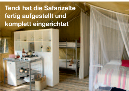
Tendi hat die Safarizelte fertig aufgestellt und komplett eingerichtet